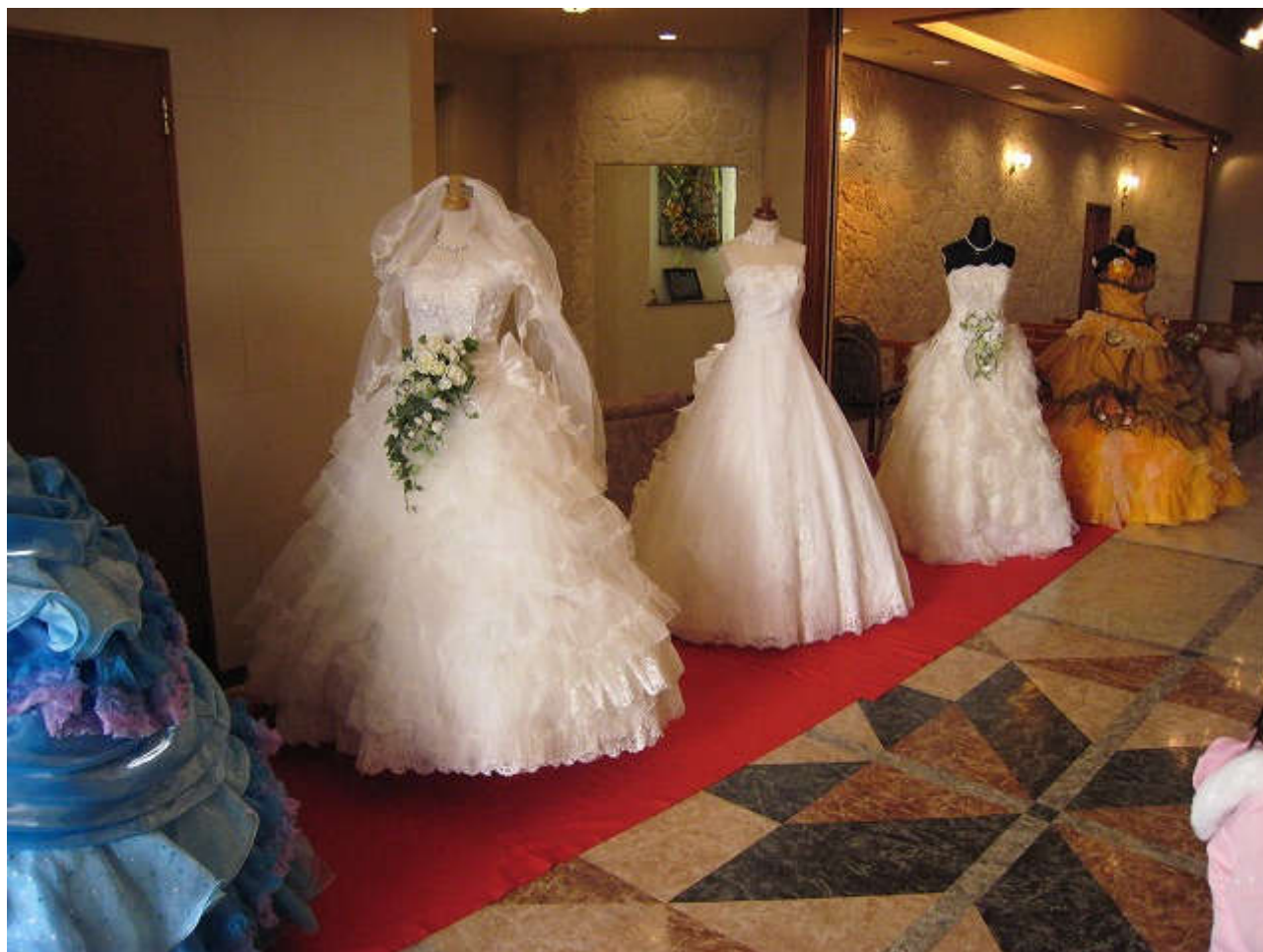
ホテル竹乃屋さんのチャペルでは、日向の『Wedding Salon・葩』さんが来られ、ウェディングドレスの試着をさせていただきますヨ♡