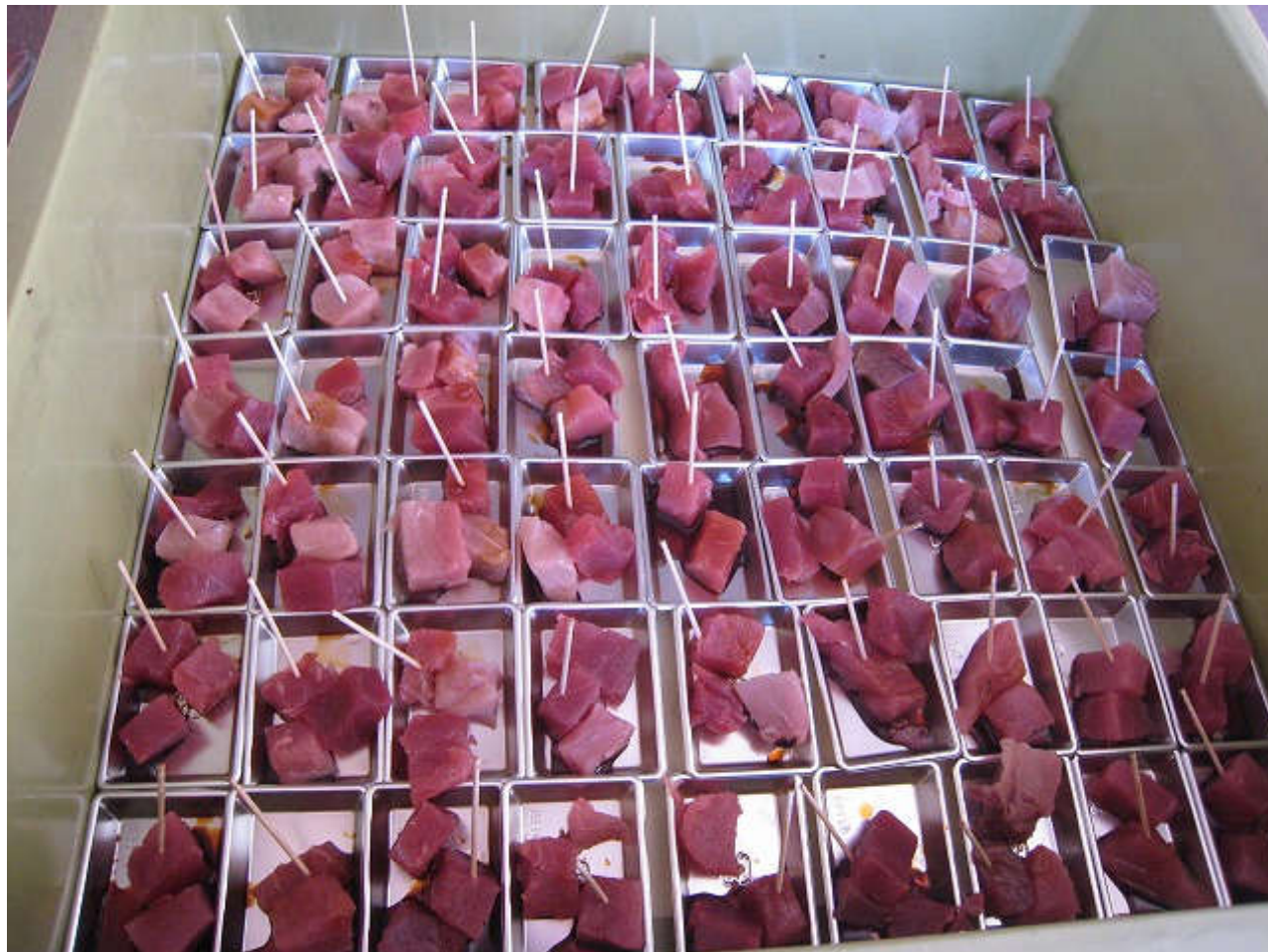
フィーレになったものを後ろで料理人達が試食用の大きさまでカットします。