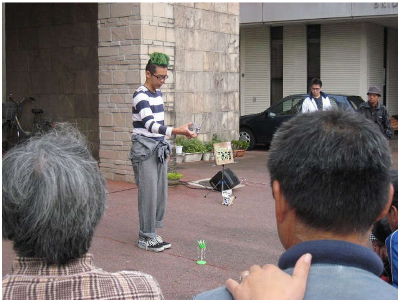
みの吉さん、大盛況でした！！また来てね～♪