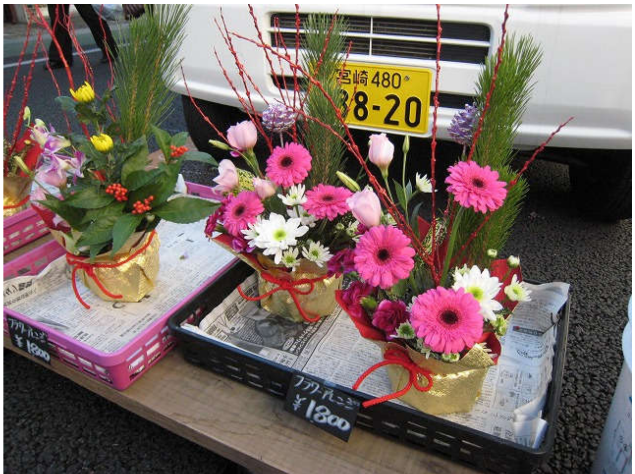
お正月用品がたくさん出品されてました☆