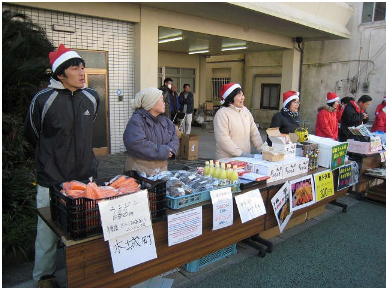
今日はクリスマス☆という事で、本部席ではサンタさんがたくさんお目見えして元気よく販売しましたよ♪(^v^)