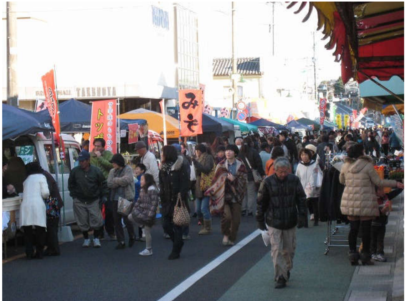
上の方もたくさんのお客様で賑わいました！