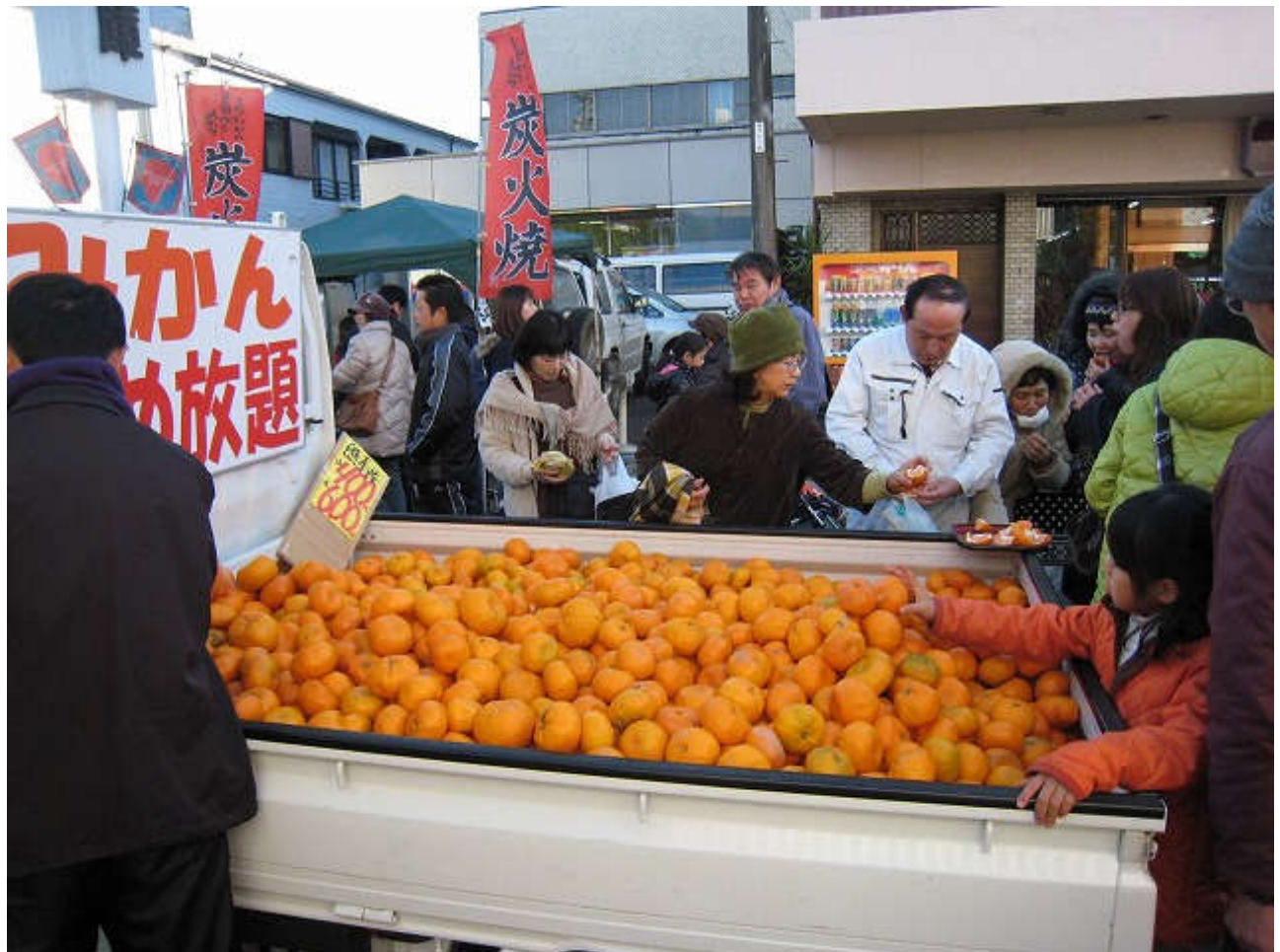
白菜やみかんでトラックにてんこもりでした！