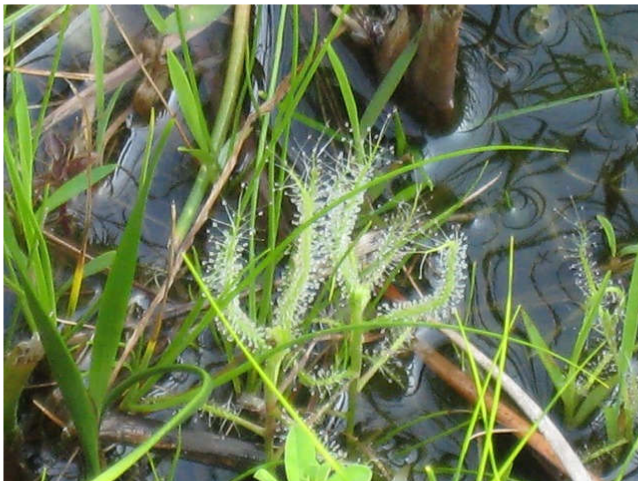
食虫植物『シロバナナガバノイシモチソウ』