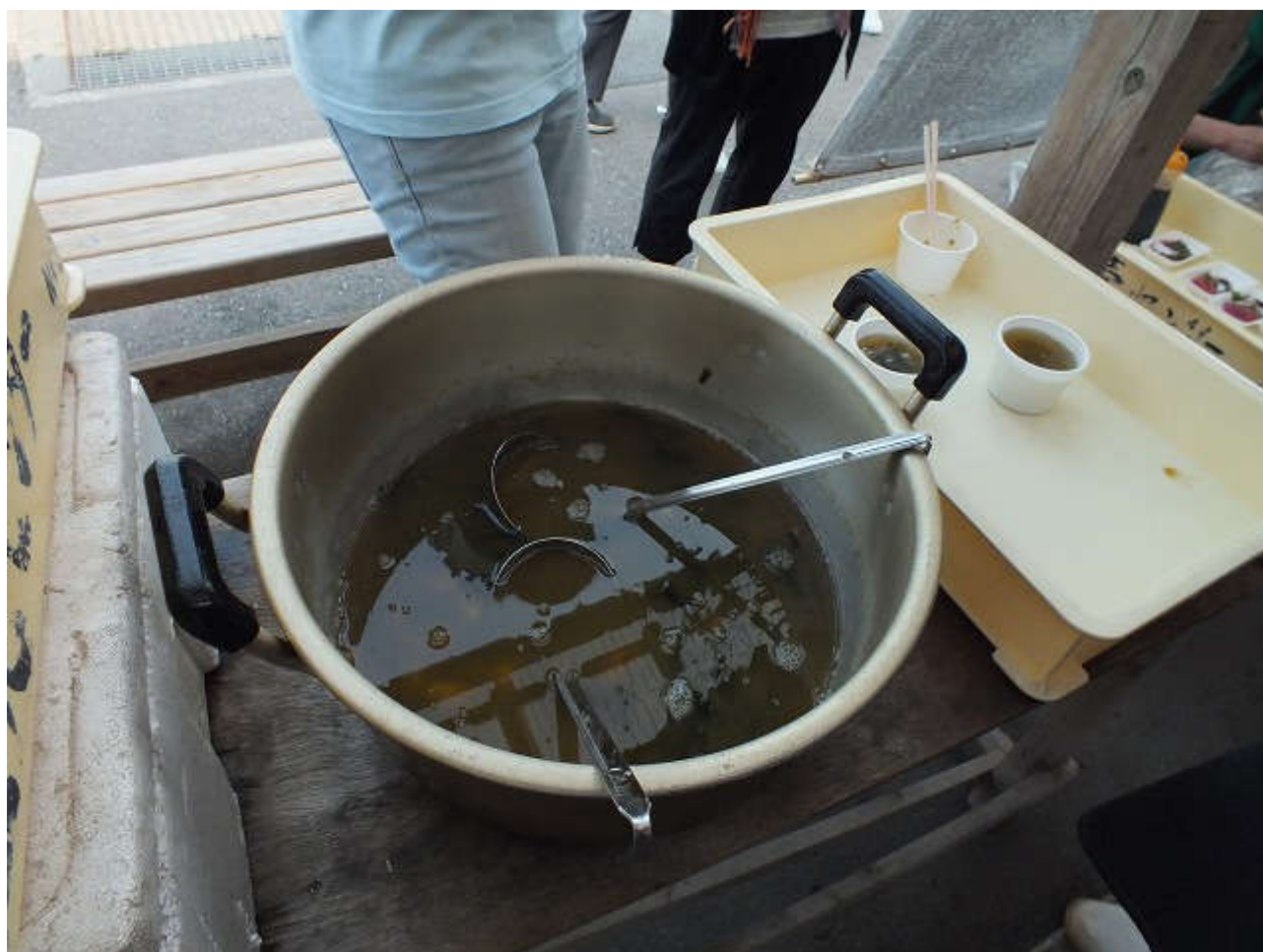
今回もおいしそうなマグロとタコのお刺身、かぼちゃとお芋の入ったエビの出汁の澄まし汁がふるまいとして用意されてました！！